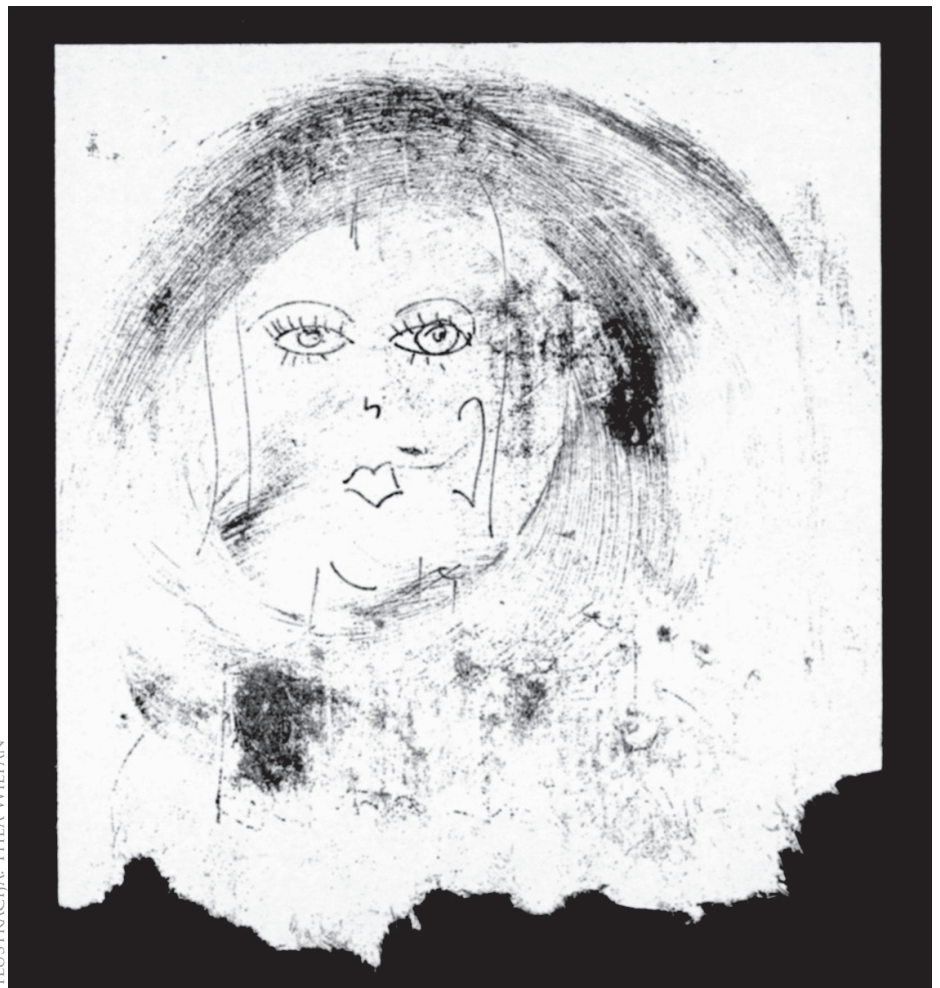
ILUSTRACIJA: THEA WILFAN

Človekova naravna odziva na stres sta »fight or flight« (boj ali beg) in sta povezana z adrenalinom in noradrenalinom. Človeku, ki se je pripravljen »bojevati ali bežati«, se poveča srčni utrip, krvni tlak naraste, pospešeno in plitvo diha, mišice se napnejo, zenice se razširijo, prebava se upočasni. Če stres traja predolgo, se pojavijo »opozorila« telesa na preobremenjenost: nespečnost, glavoboli, nepojasnjene bolečine, težave